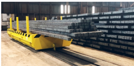
Nový přepravní vozík.

Jeřábník již nemusí pokaždé, když chce s vozíkem vyjet z haly B do haly C, odcházet z jeřábu dolů, aby otevřel vrata. Dále je vozík vybaven novým elektrickým pohonem, připevněným pod úroveň podlahy. K jeho příslušenství patří také světelná a zvuková signalizace, umístěná na halových sloupech. Ta upozorňuje zaměstnance, že je vozík v pohybu.