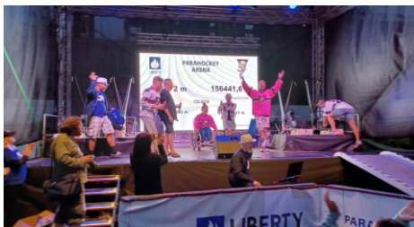
Návštěvníci Colours vyjeli pro parahokejisty 156 717 korun.

Celkem 200 tisíc korun pomohli návštěvníci Colours of Ostrava a také Festivalu v ulicích vyjet na podporu parahokejového týmu Flamingos Ostrava. Postižení sportovci si díky tomu budou moci pořídit vybavení na tréninky, finance potřebují také na pronájem ledových ploch. Společnost LIBERTY Ostrava spolu s organizací Parahockey ČR postavila na Coloursech Para Hockey Arenu, kde měli návštěvníci možnost zahrát si na zmenšeném hřišti parahokej, vyzkoušet si střelbu na bránu ze simulátoru parahokejových saní, a také na čtyřech trenezech sbírat nejen kilometry, ale i finance pro hendikepované sportovce. Ostravská huť proměnila na peníze každý ujetý kilometr. Na čtyřech trenezech se vystřídalo na 1800 zájemců.