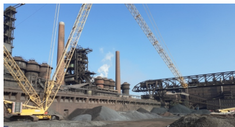
Speciální jeřáb v akci.

Na noční směně 26. července se vypouštěl slitek, tzv. salamandr, z nístěje vysoké pece připraveným nouzovým odpichovým otvorem. Vypustilo se zhruba 310 tun surového železa. Hlavním realizátorem prací byla společnost Hutní Montáže Slovakia. Výměna šikmých plynovodů byla technickou lahůdkou, bylo zapotřebí jeřáb DEMAG CC2800, který dokáže zvednout břemeno těžké 40 tun do výšky 160 metrů, a šestitunové břemeno dopraví do vzdálenosti 138 metrů od osy jeřábu ve výšce 70 metrů. Jeřáb umožnil složení rozměrných kusů plynovodů o průměru 2 metry do rudného dvora. Všechny práce skončily v září, kdy se ještě roboticky prováděl nástřik šachty pece ochranným žáruvzdorným materiálem tzv. shotcrete a vysoká pec se připravila k opětovnému zafoukání.