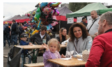
Na návštěvníky čekala nálož hudby i občerstvení.