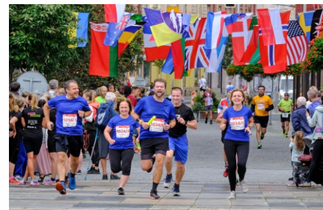
Štafeta LIBERTY Ostrava.

Jméno celé party poslal poděkování za podporu všem kolegům a samozřejmě rodinným příslušníkům, kteří naše běžecké přišli podpořit přímo na Masarykovo náměstí v Ostravě. V týmu LIBERTY Ostrava běželi čtyři muži a dvě ženy, především ajťáci. Ve firemních trikotech byli nepřehlédnutelní. Pro kolegy z huťi byli velkou inspirací, takže pro příští rok už projevili zájem i sportovci z dalších pracovišť.