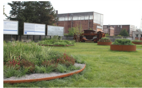
Prostranství teď kvete od jara do podzimu.

Pět stromů, desítky keřů a stovky trvalek nově zdobí prostranství před hlavní bránou LIBERTY Ostrava. Úpravy začaly už letos v lednu a byly náročné mimo jiné proto, že pozemek je plný různých vedení, které se nesmělo porušit. Navíc neobsahoval skoro žádnou zeminu, takže se musel nejprve odbarovat, a poté se musela navozit kvalitní hlína. Projekt vycházel z materiálů typických pro hutní výrobu, vyšší záhony jsou ohrazeny s využitím železa, nižší jsou ze svodidel. Součástí je také jeden z důležitých prvků naší logistiky, vagon, který je osvětlen tak, aby tvořil dominantu celého prostoru. K separaci chodníku od travnaté plochy jsou využity ocelové pásnice. Prostor je praktický, a zároveň reprezentativní. Pro výsadbu byly vybrány odolné rostliny, které zvládnou skoro permanentní slunce, a zároveň nakvétají postupně od jara do podzimu.