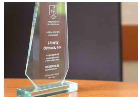
Cena za ekonomický rozvoj.

Krásnou skleněnou plastiku dostala v září naše společnost od městské části Slezská Ostrava. Na slavnostním předávání cen osobnostem Slezské Ostravy jsme ji obdrželi za ekonomický rozvoj jako největší zaměstnavatel i plátce daní v regionu, za podporu potřebných projektů v obvodu, a také za významnou pomoc lidem prchajícím před válkou na Ukrajině.