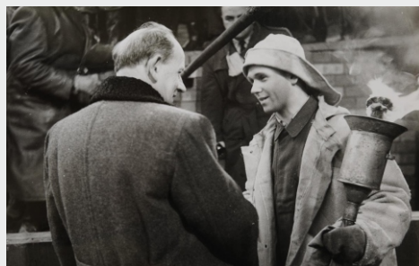
Antonín Zápotocký při zapalování pece.

Letos měl únor jen 28 dní, takže jsme nemohli v přesném termínu oslavit výročí prvního odpichu na vysoké peci číslo 1, který se uskutečnil 29. února 1952, dva měsíce po jejím zapálení za účasti tehdejšího předsedy vlády Antonína Zápotockého. Zapalovala se symbolicky ohněm ze staré ocelárny Vítkovických železáren Klementa Gottwalda 1. ledna 1962. První tuny surového železa vypustili taviči v době, kdy na agregátech ještě pracovali montéři, kteří se museli nejen poprat s nedostatkem vlastních zkušeností, ale zároveň také čelit nepříznivému zimnímu počasí.