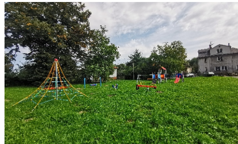
Hřiště začíná lákat děti k návštěvě s příchodem prvních teplých dní.

se nachází v zástavbové oblasti, kde bydlí rodiny s dětmi. Je v bezpečném místě. Určeno je k rekreačnímu využití pro děti předškolního i školního věku, dostupné je též dětem z nedaleké školky ve Frýdecké ulici. Jsou na něm houpačky, prolézačky, houpadlo na pružině, dvojhrázda, hrací sestava se skluzavkou a síťová pyramida. Doplňeno je o nový městský mobiliář. Naše pomoc ale loni směřovala také do Vratimova, Radvanic a Bartovic, Šenova, Havířova či Ostravy – Jihu.