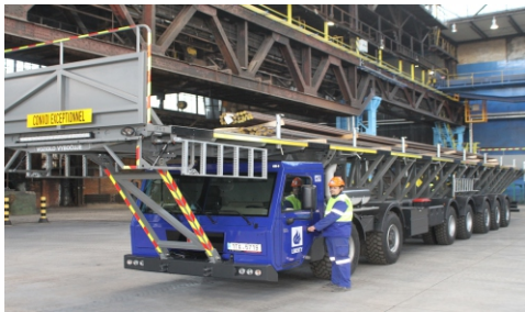
Nový vůz je nejdelší tatra v historii výroby kopřivnické automobilky.

Auto je vybaveno motorem Tatra o výkonu 300 kW a automatickou převodovkou. K původním šesti je přidána sedmá náprava, aby se dosáhlo požadované celkové nosnosti vozu přes 70 tun a užitečného zatížení takřka 50 tun.