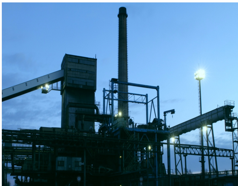
Svítidla se mění nejen v halách, ale u koksovny také na komunikacích.

„Investice nám navíc umožní uvolnit část omezených externích kapacit elektroenergetické distribuční sítě v Moravskoslezském kraji,“ uvedl vedoucí projektu Vladimír Machát.