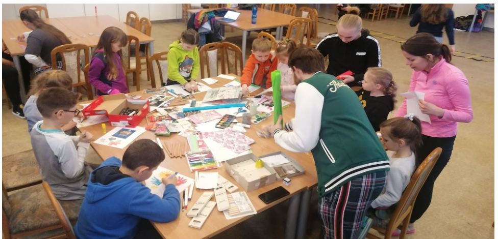
Studenti Ostravské univerzity připravili pro ukrajinské děti volnočasový program.

Bylo 27. února a na hotelový dům Kovák měli autobusem přijet první uprchlíci z Ukrajiny. V pokojích chybělo nějaké vybavení jako třeba věšáky, nebylo dost osušek a toaletního papíru. Na žádost o pomoc zveřejněné na sociálních sítích reagovaly desítky lidí, zaměstnanců hutě i obyvatel z okolí, a doslova zavalili Kovák vším, co by se mohlo lidem na útku před válkou hodit. Autobus přijel s několikadenním zpožděním, a pak najížděly další autobusy i auta. Mnozí uprchlíci měli Kovák jen jako krátkou přestupní stanici, celkem jich byla zhruba stovka. Nakonec u nás zůstalo přes padesát žen a dětí, většinou svazbou na Ostravu. Příbuzní mnohých pracují u nás v hutě. A vlna pomoci neslábla. Ozývaly se organizace, firmy i jednotlivci. Studenti Ostravské univerzity, taneční škola MG Dance i zaměstnanci hutě připravili program pro děti. Římskokatolická farnost z Kunčic nabídla svou zahradu, nedaleké trampolinové a parkourové centrum NH Freestyle poskytlo dětem volný vstup. Své brány bezplatně otevřel také Velký svět techniky v DOV. Pekárna Karla Hanka z Petřvaldu přivezla