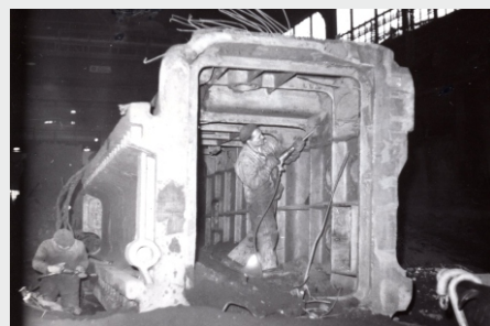
Odlitek pro NSR.

Letos uplynulo 65 let, co byla po pěti letech výstavby uvedena do provozu velká, nebo také hrubá slévárna. První desetinnová kokila se slavnostně odlila 15. března 1957. Malá slévárna už byla v té době zhruba rok v provozu. Hlavními odběrateli kokil byly vedle vlastní kunčické ocelárny také další hutní a strojírenské podniky jako VŽKG Ostrava, SONP Kladno, Škoda Plzeň, ŽD Bohumín, ŽĐAS Žďár nad Sázavou, ČKD Kutná Hora a SMZ Dubnice. Do konce roku 1957 vyrobila velká slévárna přes 8 tisíc tun odlitků, převážně kokil. Slévárna NHKG byla v té době jejich jediným dodavatelem v Československu. O rok později se zahájilo také lité supertěžkých kokil.