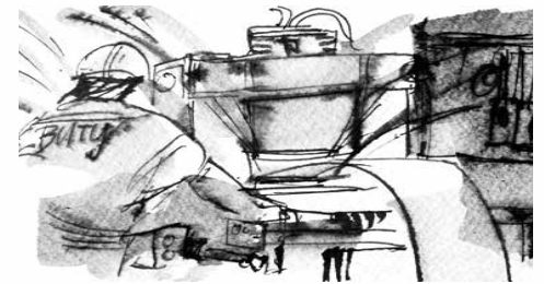
V publikaci jsou ilustrace známého ostravského výtvarníka Václava Šipoše.

dcera zaměstnance rourovny LIBERTY Ostrava. Její rodiče doufají, že dívka, která se narodila bez prstů pravé ruky a vedle autismu má další přidružené choroby, najde díky organizaci Světlo autismu své pevné zájemci v době, kdy už oni sami nebudou zvládat péči o dítě s postižením. Publikaci uchováající originální mluvu hutníků doplňují snímky technologií od špičkových fotografů, a zalidňují ji originální kresby.