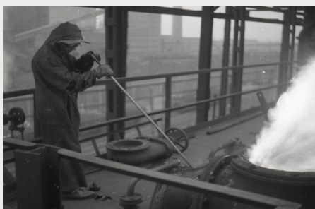
Koksovna v roce 1955.

Prvního února 1952 uplynulo 70 let ode dne, kdy byla osazena první koksovací komora v naší huti. Plán na výstavbu nové koksovny ve Vítkovických železárnách vznikl již před druhou světovou válkou. Po roce 1945 se od něj opustilo, protože nová koksovna se měla stavět v OKD. Rozhodnutí o výstavbě koksovny v Kunčicích padlo v roce 1948. Stavba první koksové baterie skončila již v říjnu 1951, ale pro zásadní nedodělky najela do plného provozu až v průběhu ledna a února 1952. Když byla k 31. prosinci 1951 zřízena Nová huť jako samostatný podnik, pracovalo v koksovně 122 zaměstnanců.