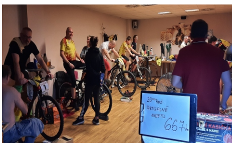
Osm chlapů makalo 24 hodin na pomoc neonatologii.

Již druhý ročník dobročinné akce zajistil dostatek prostředků na koupi fotoaparátu Instax, kterým bude novorozenecké oddělení pořizovat snímky miminek pro maminky ležící na JIP ještě před tím, než se mohou poprvé osobně potkat se svými čerstvě narozenými dětmi. Pro mámy moc potřebná a důležitá pomoc a vzpruha. Dát dohromady peníze na přístroj se podařilo ještě před zahájením vydařené sportovně-charitativní akce. A tak se na místě, v restauraci Bowling sky, která poskytla příjemné zázemí, vybralo od podporovatelů, kamarádů a návštěvníků dalších více jak